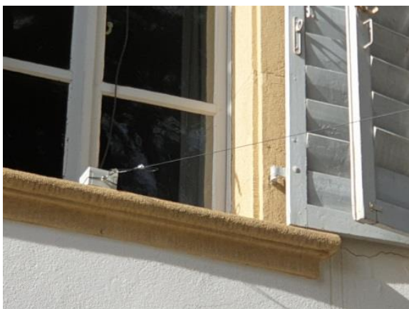
Balun de l'antenne End Fed

Par une belle journée de février nous avons activé deux émetteurs/récepteurs en ondes courtes et ultracourtes (HF et UHF) et une chasse aux renards (radiogoniométrie). La station HF était un IC7300 100W avec une antenne End Fed pour les bandes de 80 mètres à 10 mètres. La station UHF était un FT8800 30 W avec une antenne Yagi 3 éléments fixée à l'intérieur du bâtiment.